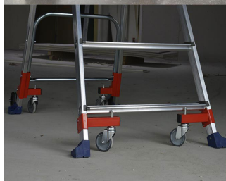
Roues escamotables et patins antidérapants