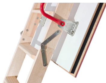
Poignée de l'échelle