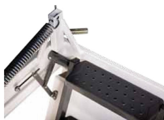
Marches de l'échelle